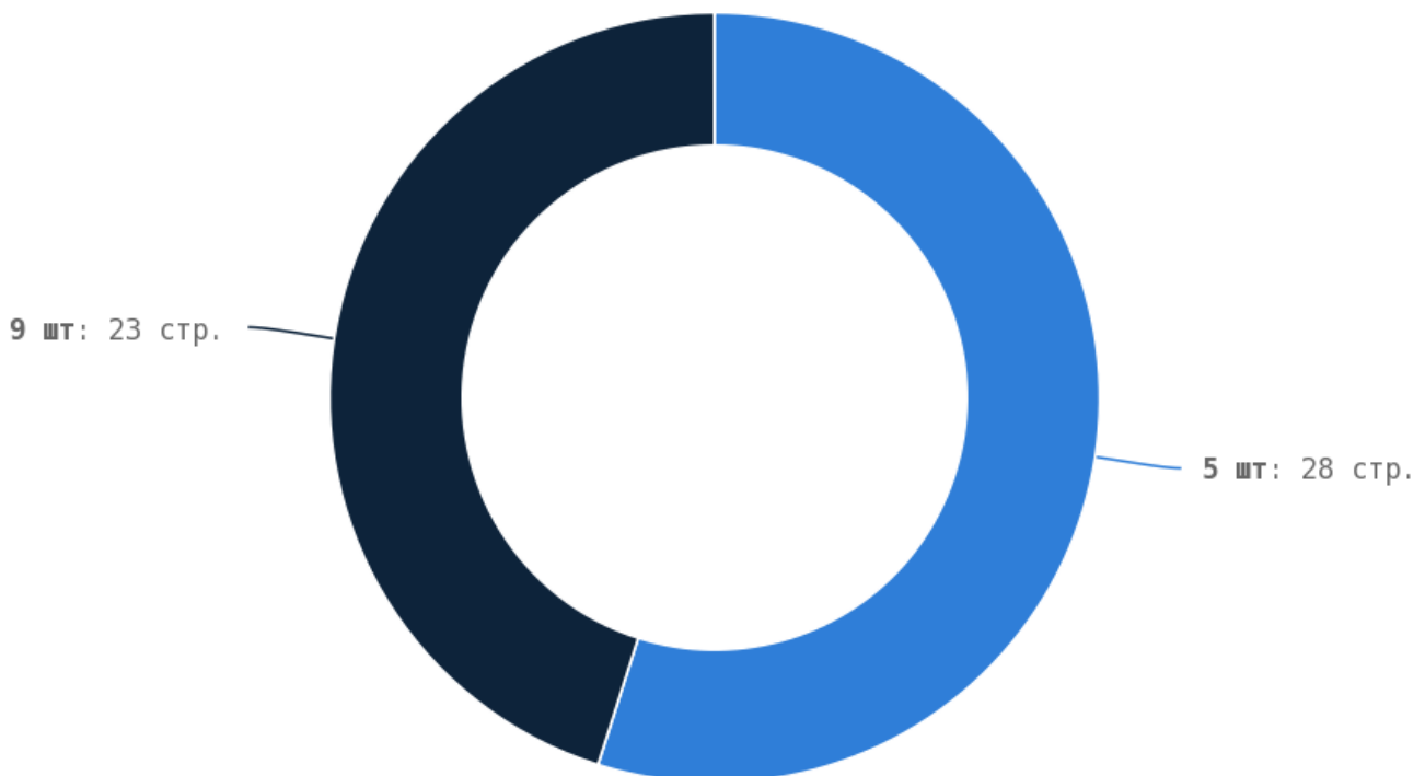
Распределение тегов <B> по страницам сайта

Не рекомендуется комбинировать оба этих тега в рамках одной фразы и создавать вложенные конструкции.